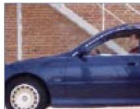
Barrido progresivo, todas las líneas se muestran a la vez