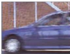
Entrelazado, 20 ms diferencia entre líneas pares y líneas impares