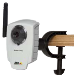
Cámaras de red AXIS 207/207W con pinza de montaje flexible - pinza incluida