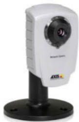
Cámaras de red AXIS 207/207W con soporte de cámara - soporte incluido