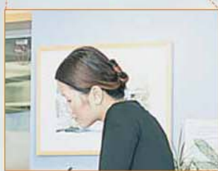
Zoom óptico de 3 aumentos (imágenes simuladas)